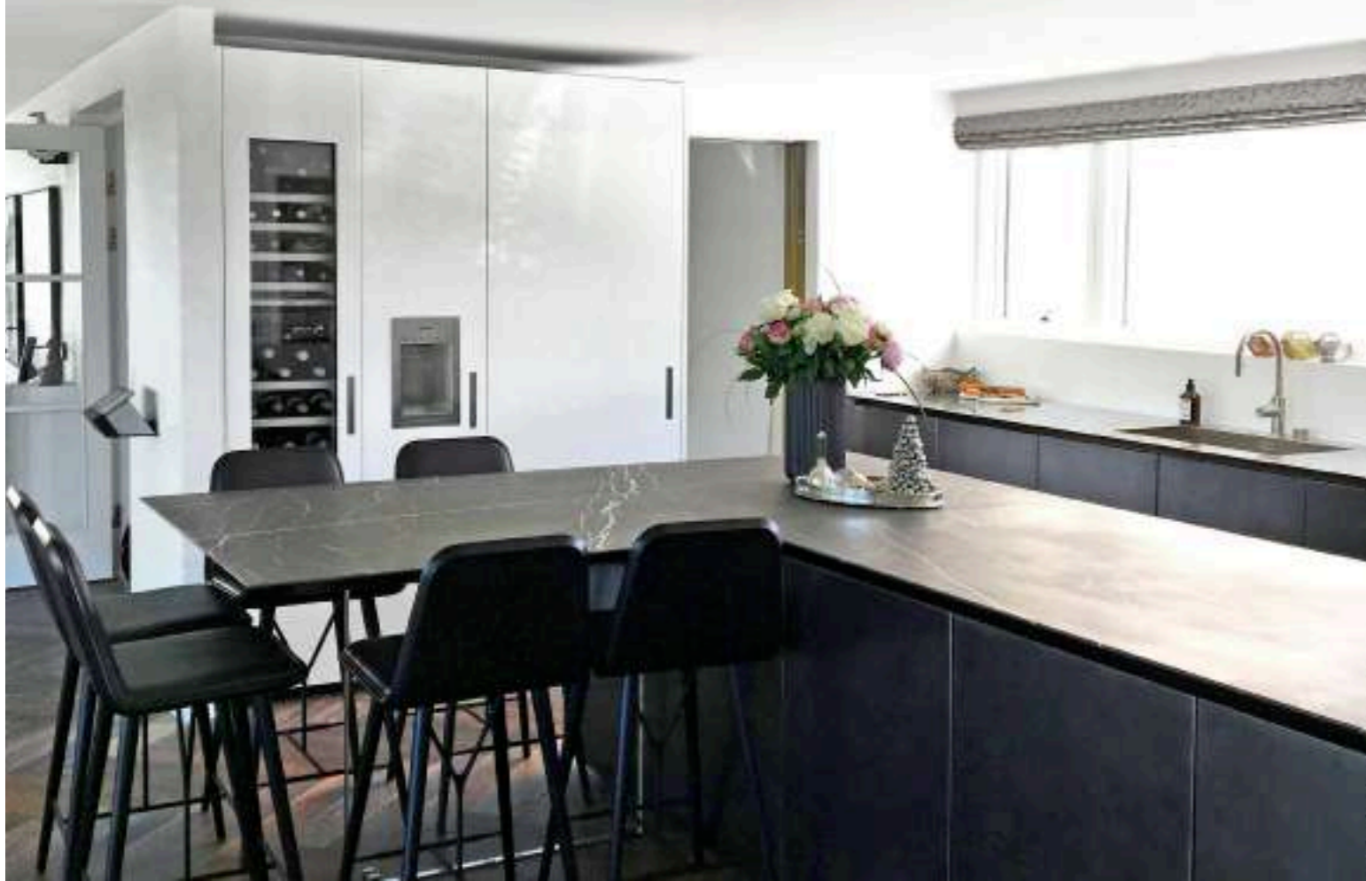
K14 / Cucina Kitchen pag. 52, 53