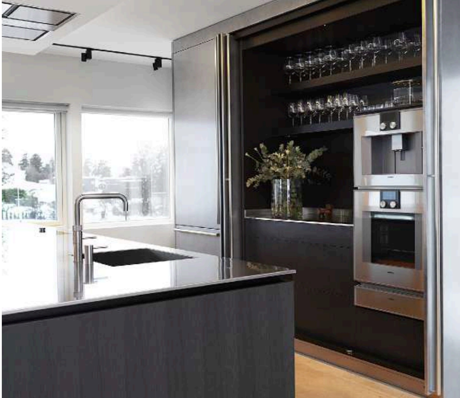
XILA / Cucina Kitchen HIDE / Colonne Tall units pag. 46, 47