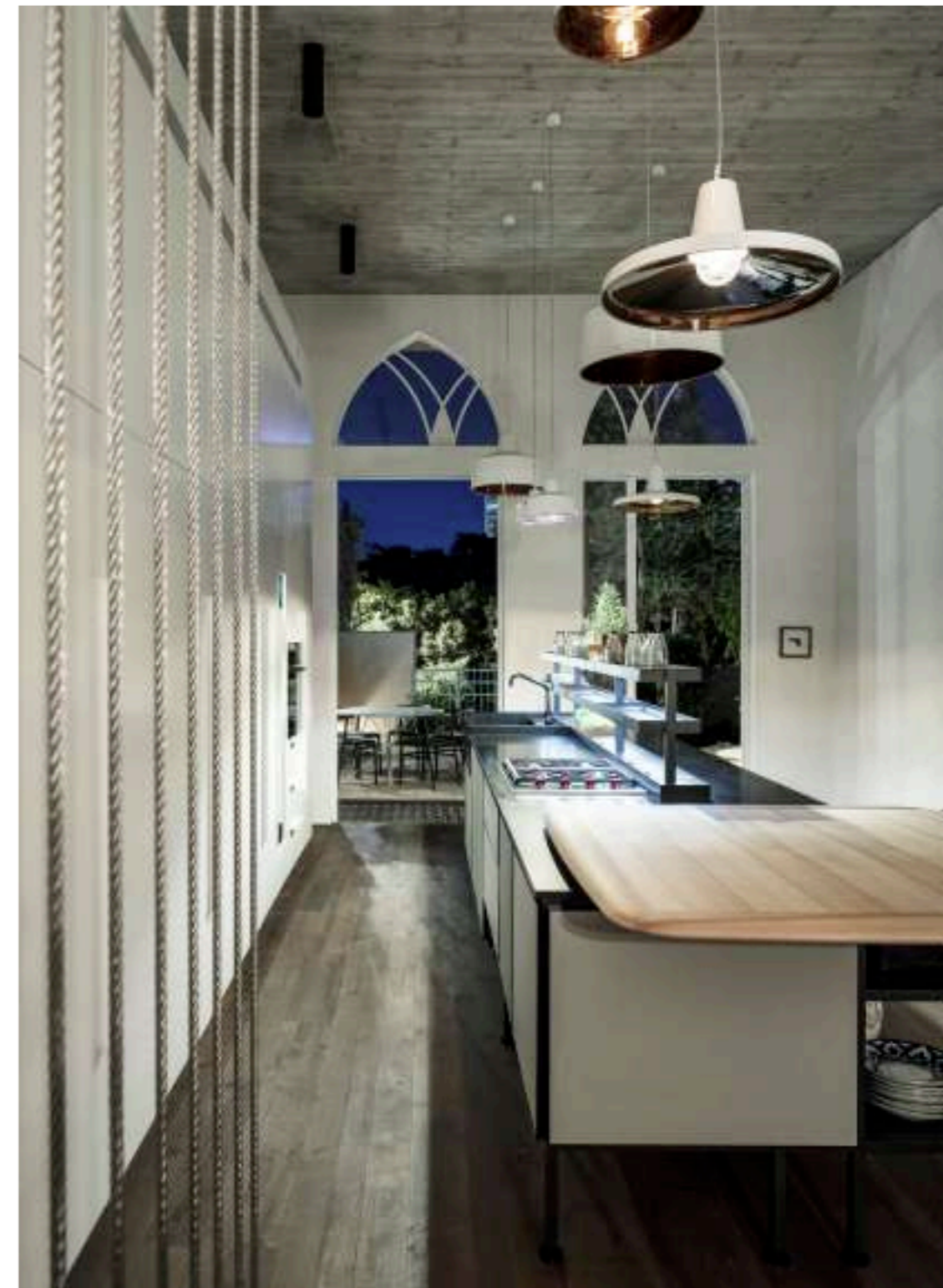
SALINAS / Cucina Kitchen pag. 62, 63