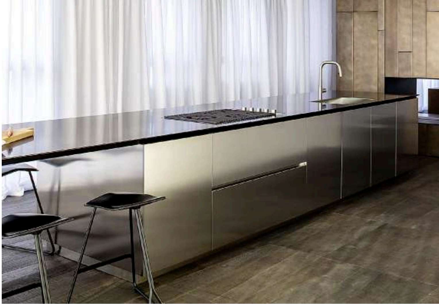
K14 / Cucina Kitchen PROGRAMMA STANDARD / Colonne con maniglie Duemilaotto Tall units with Duemilaotto handles pag. 80, 81, 82 83